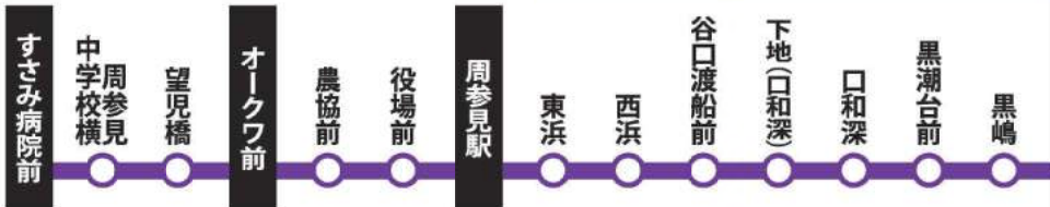
里野・和深方面行き