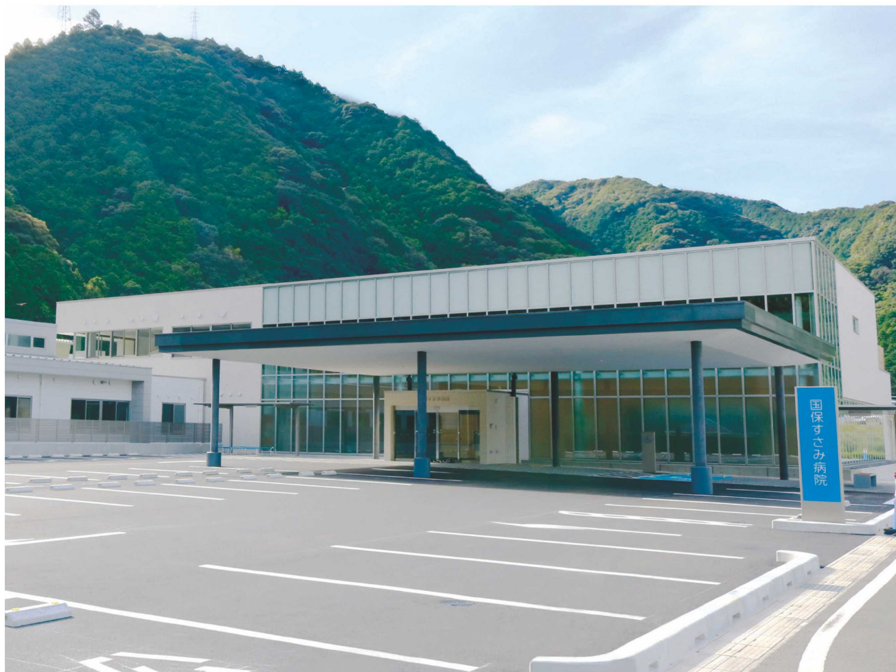
(新国保すさみ病院)