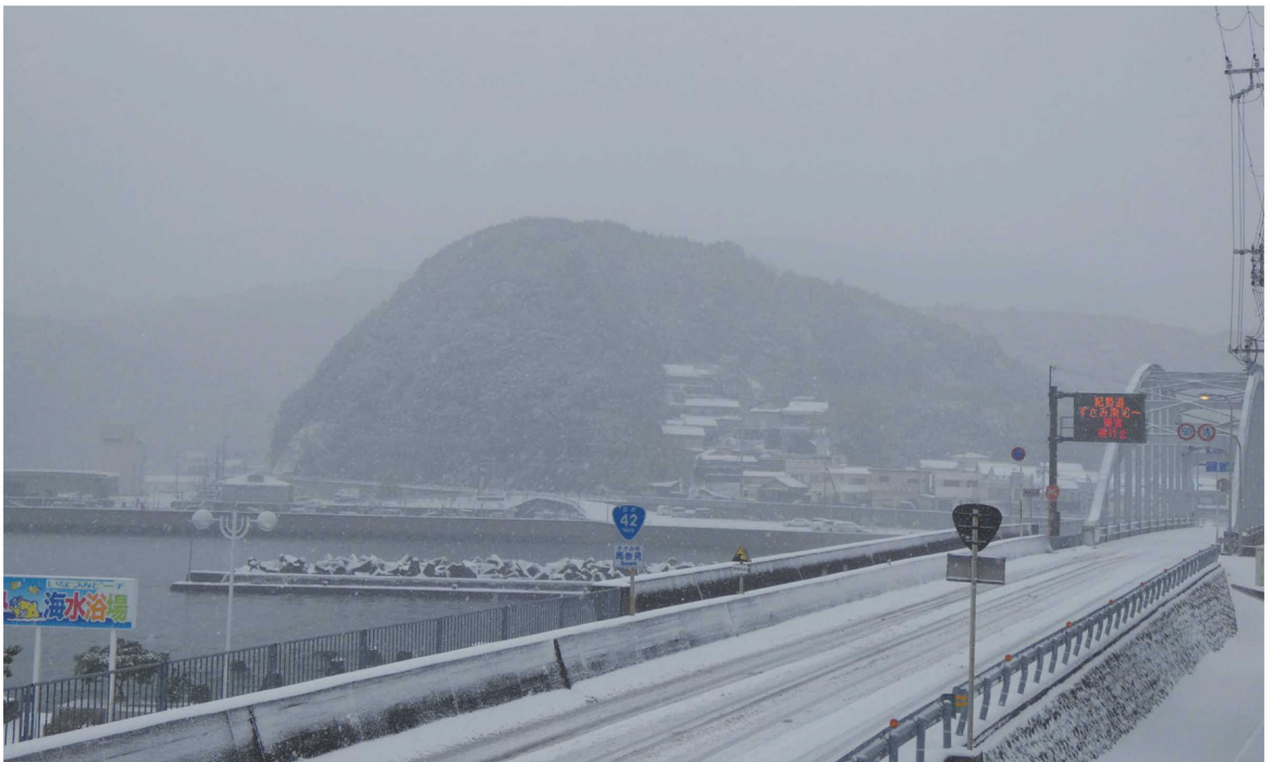
令和5年1月24日の大雪

きなかった職員数ですが正職員は23名でありまして。2点目の地元の職員についてですが地方公務